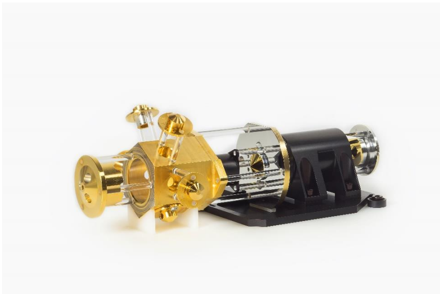
Abb. 2: Die am Fraunhofer IOF realisierte Radiometrische Kalibrierungsspektralquelle (RCSS) diente zur Kalibrierung eines der Webb-Messinstrumente am Boden.